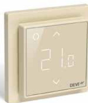
DEVIreg Smart Ivoire (RAL 1013) réf. 140F1142