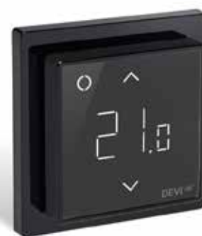
DEVIreg Smart Noir pur (RAL 9005) réf. 140F1143