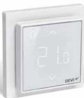
DEVIreg Smart Blanc polaire (RAL 9016) réf. 140F1140